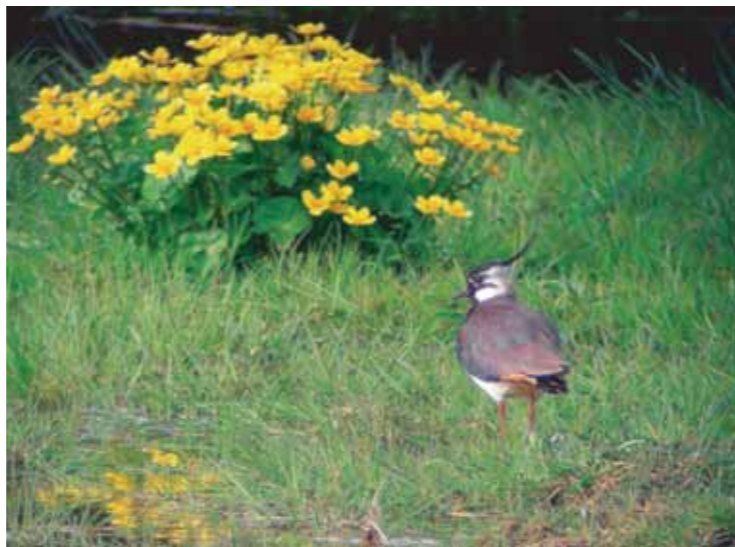
kabeleka och tofsvipa på strandmaden

I Lissmadalen finns två uppskyttade vandringsleder. Slingan runt sjön är cirka tre kilometer lång. Ett flertal passager går över rejäla stätter med räcke och över spänger genom vass och fuktig strandskog. Våtmarken kan här upplevas på nära håll. Den andra slingan leder dig österut cirka två kilometer och tar dig genom ett kulturlandskap med fuktmarker och hagmarker. I detta landskap kan du njuta av kulturmarkens fåglar, hagmarkssvampar och ängsblommor.